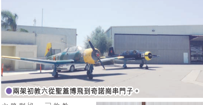
兩架初教六從聖蓋博飛到奇諾崗申門子。