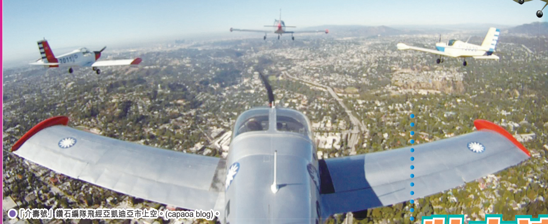
「介壽號」鑽石編隊飛經亞凱迪亞市上空。(capaoa blog)。