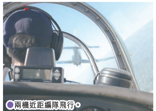
兩機近距編隊飛行。