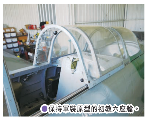
保持軍裝原型的初教六座艙。